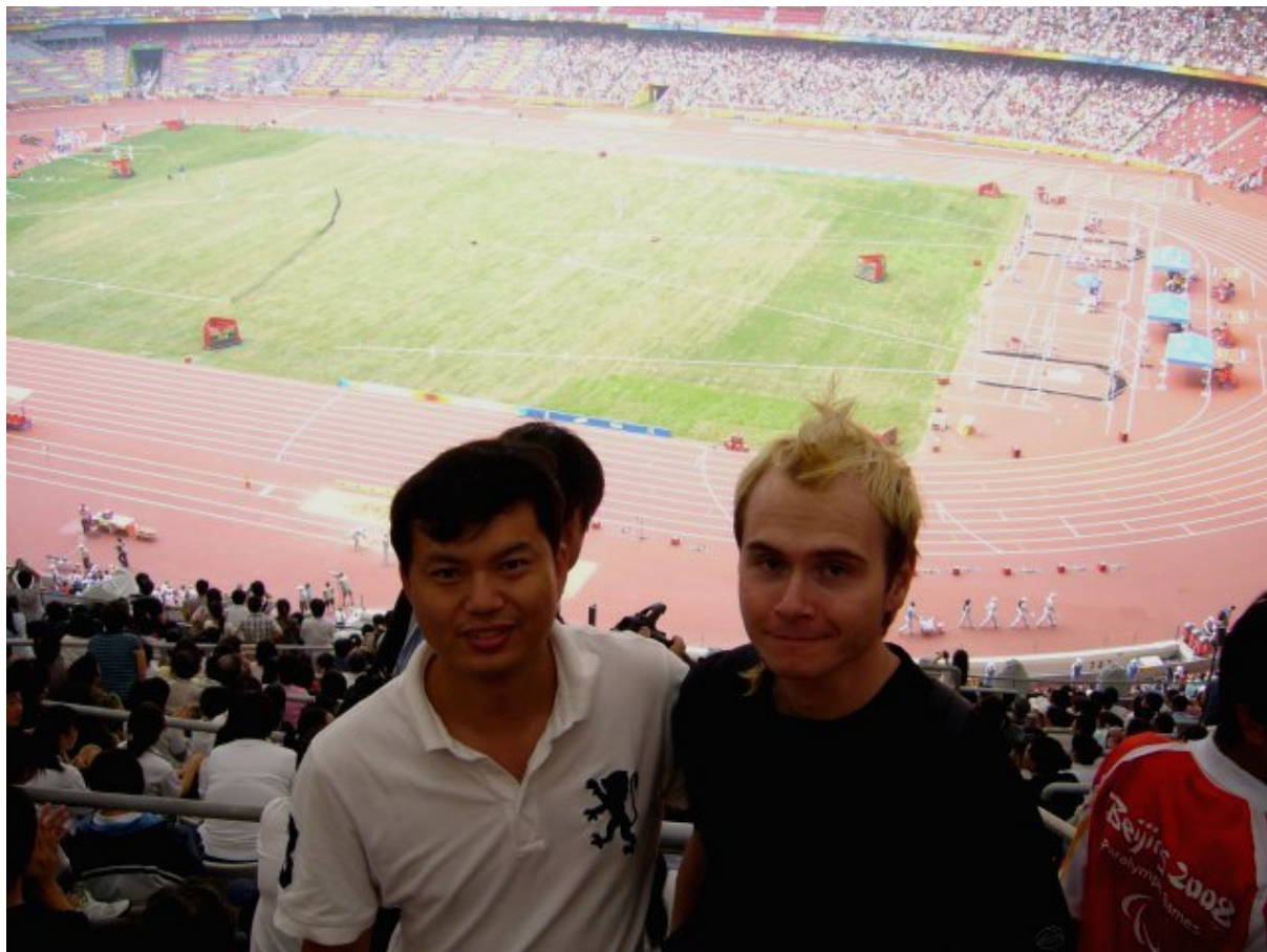
Kuva 2: Työporukan kanssa Paralympialaisia katsomassa