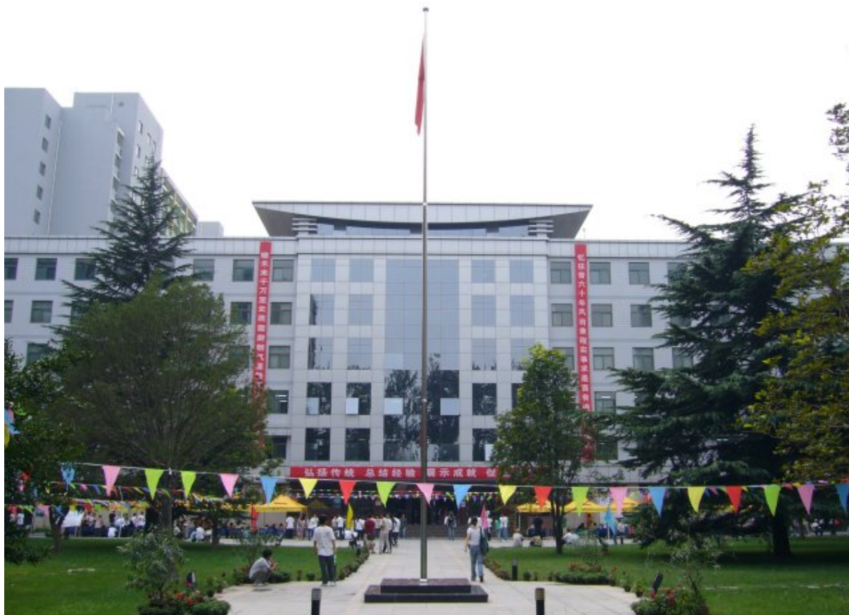
Kuva 5: CYUPSin päärakennus

CYUPSin kampusalueella on kaksi pientä päivittäistavarakauppaa joista löytää melkein kaiken tarvittavan, kaksi hedelmäkauppaa, leipomo, ruokala (jossa tosin ei voi syödä ilman naapurin lainaamaa opiskelijamaksukorttia), parturi, terveysasema, kolme kansainvälisillä nostokorteilla toimivaa pankkiautomaattia, yleisurheilukenttä ja maksullinen kuntosali. Kampuksen ulkopuolelta (noin 1 km säteellä) löytyy lukuisia pieniä kauppia, videoliikkeitä, paikallisia ravintoloita, pitsapaikkoja, pankkeja ja jokunen kansainvälinen pikaruokaravintolakin. Iso osa pekingiläisistä yliopistoista on sijoittunut juuri kaupungin luoteispuolelle, ja CYUPS on tämän yliopistorykelmän eteläisimmässä päässä.