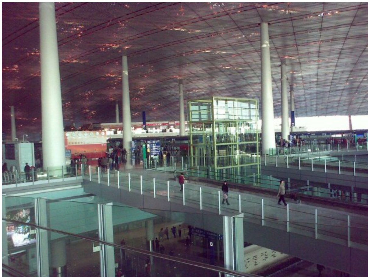
Kuva 3: Olympialaisia varten valmistunut 3. terminäli tekee Pekingin lentokentästä maailman suurimman

Lentoliput varasin heti viisumin saatuani heinäkuussa, jolloin edestakaisten lentolippujen hinta oli ehtinyt nousta jo 995,41 euroon. Kilroy Travelsin kautta sain todennäköisesti halvimmat edestakaiset reittilentoliput, joihin pienellä lisämaksulla yli 26-vuotiaskin opiskelija saa lentopäivien muutosoikeuden. Tämä optio osoittautui kannattavaksi päätettyäni harjoittelun lähestyessä loppuaan jättää matkustelun Kiinassa seuraavalle kerralle.