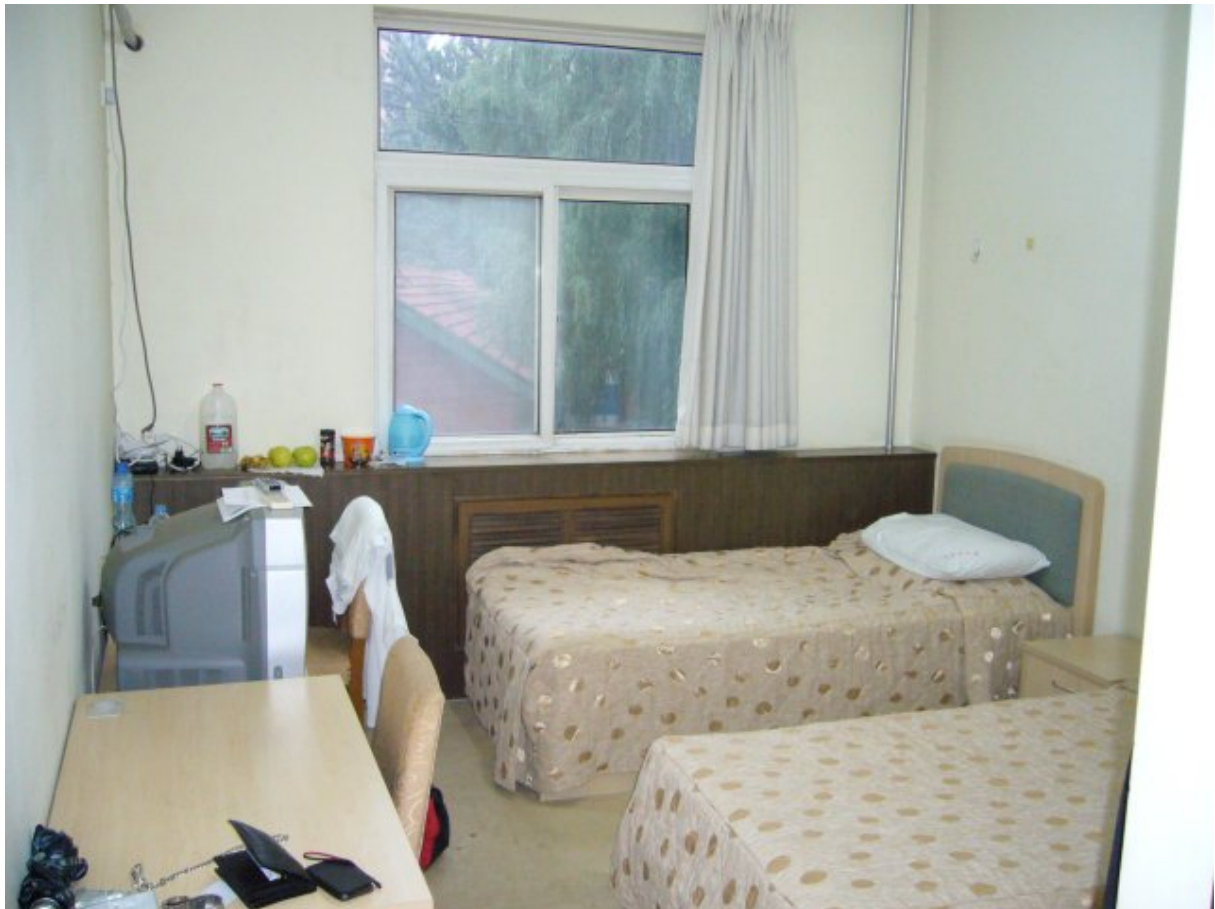
Kuva 4: CYUPSin Overseas Student Dormitoryn huone

NE Institute on valmis järjestämään harjoittelijoilleen majoituksen ensisijaisesti CYUPSin (中国政法大学, China Youth University for Political Sciences) asuntolalla, joskin NE Institutun apua voi kysyä myös muuta kautta hankittavan asunnon järjestämiseen. Ensimmäiset päiväni Pekingissä vietin NE Institutun omistamassa Courtyard hotellissa, koska asuntoni vuokrasopimus alkoi vasta syyskuun 1. päivä. Courtyard vastasi lähinnä vaatimatonta suomalaista motellia, mutta 198 €:a yöltä, ilman aamiaista tuntui kohtuulliselta hinnalta miljoonakaupungin keskustassa. Itse valitsin CYUPSin asuntolan, vaikkakin olin kuullut kauhutarinoita kiinalaisten opiskelija-asuntoloiden laadusta. 2000 €:a kuukaudelta ja vaatimaton 50 €:n takuumaksu olivat hyvin kohtuullinen hinta Pekingin 3. kehätien varrella sijaitsevasta, hieman alle 20 m 2 kahden hengen huoneesta.